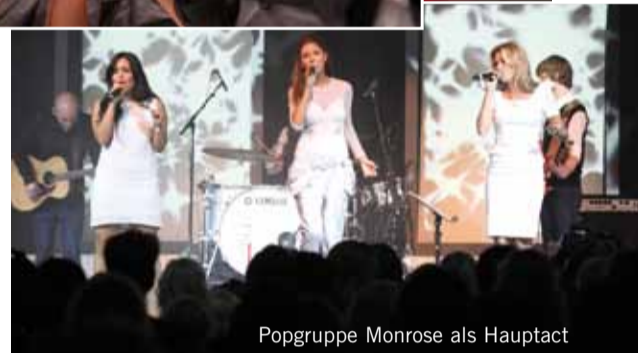
Popgruppe Monroe als Hauptact